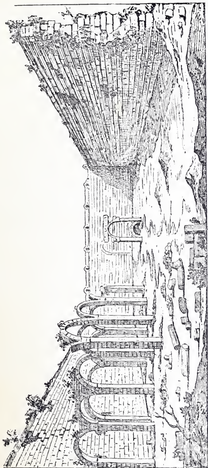
VUE INTÉRIEURE DES RUINES DU GRAND KARS-EL-EKÉWEIN [Dessin de O'COLLAGHAN, d'après un lavis de ROUSSEAU.]